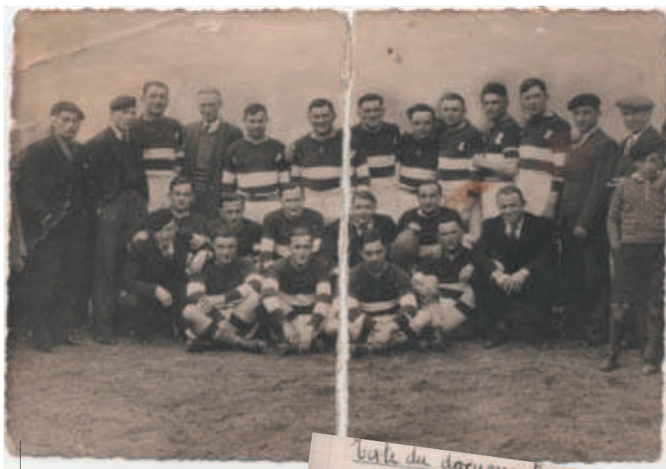
Equipe 1933-34 ?